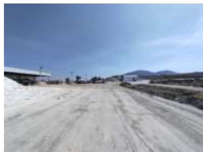
เส้นทางขนส่งแร่ในพื้นที่โครงการ