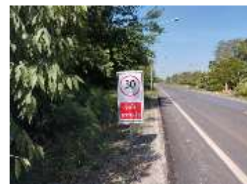
ทางหลวงหมายเลข 225