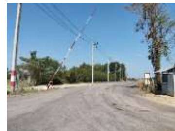
เส้นทางเข้าสู่พื้นที่โครงการ