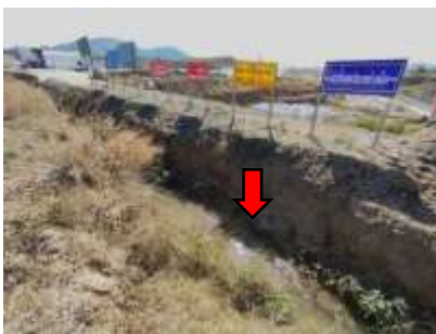
คันทำนบดินและคูระบายน้ำ